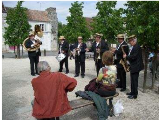
....ou on flâne dans la ville et on écoute la musique, avant de retourner aux Pavillons-sous-Bois.

Nos invités repartirent en Allemagne, après une dernière soirée passée en famille. Nous souhaitons que ce week-end européen exceptionnel ait contribué à rapprocher Eichenau et Les Pavillons-sous-Bois, dans la perspective d'un jumelage entre nos deux villes.