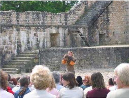
L'après-midi, on assiste au spectacle des rapaces....