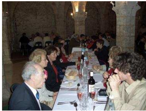
Après avoir suivi très attentivement la visite guidée à travers la vieille ville, nos jeunes sont installés à leur table. (cf. ci-dessous)