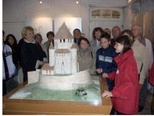
Les 250 personnes qui participent au voyage à Provins sont réparties en groupes. Ci-dessous un groupe très attentif avec un guide germanophone, devant la tour de César.